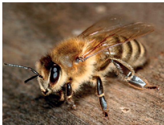
Abelha-doméstica ( Apis mellifera ) e Percevejo-da-malva-arbórea, de fogo ou da máscara africana ( Pyrrhocoris apterus )

Em termos de biodiversidade, Lisboa possui ainda uma grande riqueza (sobretudo graças à grande área florestal do Parque de Monsanto e à importante