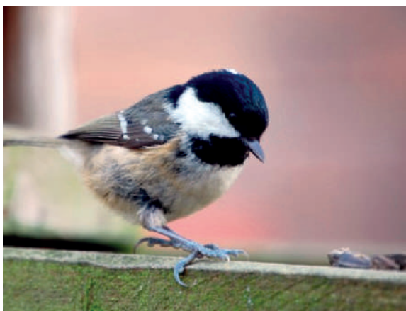
Melro ( Turdus merula ) e chapim-preto ( Parus ater )

No edificado, como se disse, muitas das espécies presentes em Lisboa são aves características de habitats rupícolas, como as andorinhas, pardais e pombos, que encontraram nas fachadas edificadas um habitat similar ao original, isto a par de uma alimentação relativamente fácil (insetos no caso das primeiras, ou restos de comida ou alimento fornecido por alguns municípios no caso das segundas). Associados a eles, os seus predadores naturais como os diferentes falcões: os peneireiros-de-dorso-malhado e os falcões-peregrinos surgem nalguns locais (por vezes com a colaboração