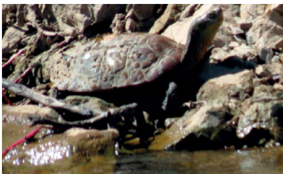
Sapo ( Bufo bufo ) e cágado-mediterrânico ( Mauremys leprosa )