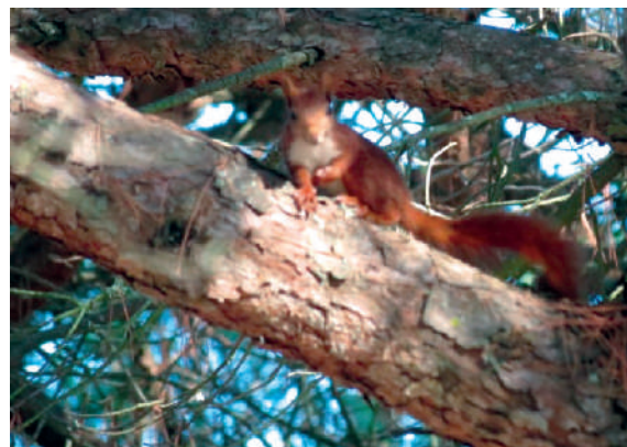
Esquilo-vermelho ( Sciurus vulgaris infuscatus )

Quanto aos mamíferos, para além dos gatos e cães abandonados e assilvestrados, os nossos comensais mais comuns são os ratos e as ratazanas, mas existem também diversas colónias de morcegos e ouriços-cacheiros. Já no Parque Florestal de Monsanto ocorrem ainda coelhos, musaranhos, toupeiras e diversas espécies de ratos silvestres e os seus predadores, como a raposa e a geneta. Não nos podemos esquecer do esquilo-vermelho, recentemente reintroduzido e que se reestabeleceu em Monsanto, sendo por vezes visto também na periferia, já dentro da cidade.