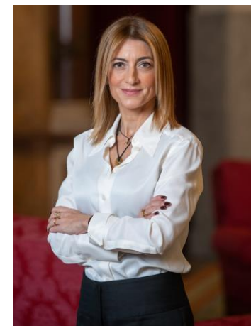
Vereadora do Pelouro da Educação

O Passaporte Escolar é a licença ideal para percorrer livremente todas as áreas do conhecimento sem sair de Lisboa. Votos de sucesso para todos os que embarcam nesta viagem!