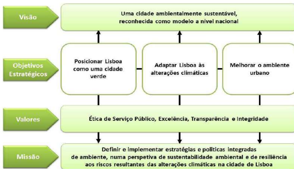
Figura 1 – Bilhete de Identidade da DMAEVCE

A estratégia de gestão na DMAEVCE alicerça-se na sua identidade institucional: Visão, Missão, Valores e Objetivos Estratégicos e na sua Estrutura Organizacional, expressa, sinteticamente, nas figuras seguintes.