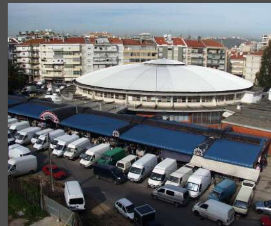
Mercado de Benfica