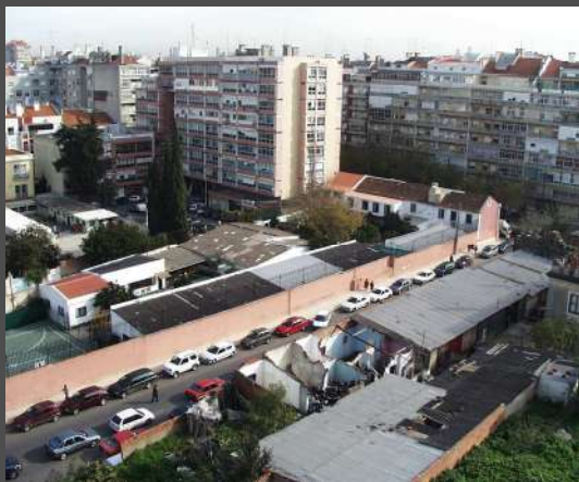
Colégio Grão Vasco