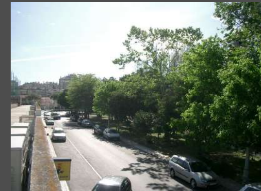
Jardim junto ao Mercado