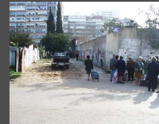
Caminho junto ao muro do Colégio