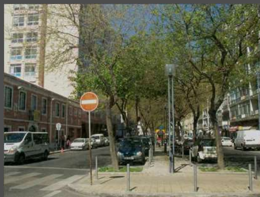
Av. Grão Vasco