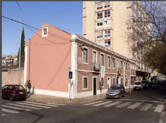
Colégio Grão Vasco