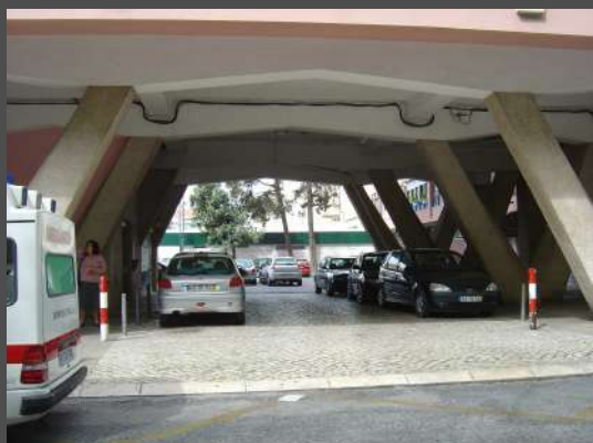
Ligação da Av. Grão Vasco ao interior do quarteirão