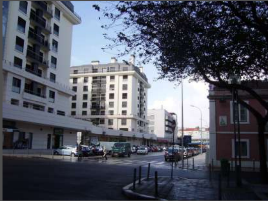
Rua Olivério Serpa