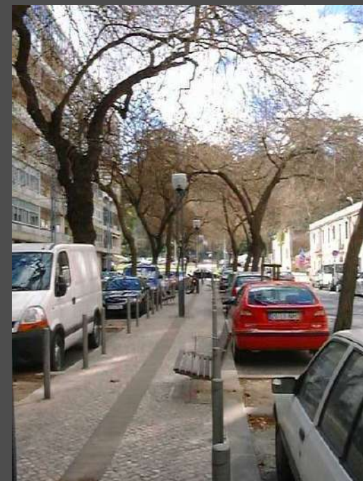
Av. Grão Vasco