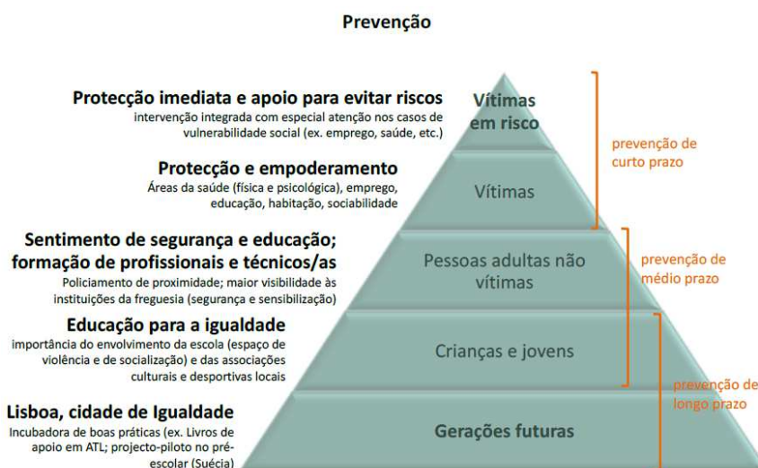
Pirâmide pag. 214 do IMVDG Concelho de Lisboa

Será imprescindível, de forma a promover um planeamento e uma intervenção integrada, a ligação com os demais Eixos do PDS, nomeadamente: Eixo 1: Reforço e Territorialização da Rede Social de Lisboa; Eixo 2: Intervenção em Públicos-alvo- Crianças e Jovens, Pessoas Idosas, Eixo 3: Intervenção em Domínios de Maior Vulnerabilidade; e Eixo 4: Promoção da Empregabilidade.