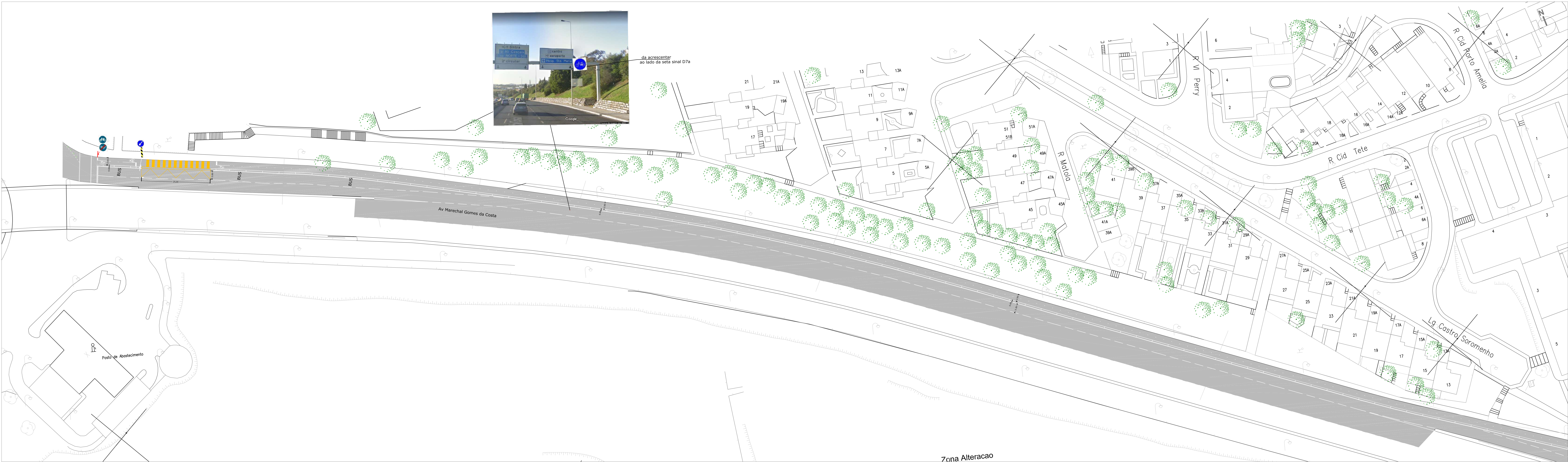
ZONA 01 ESCALA 1:500