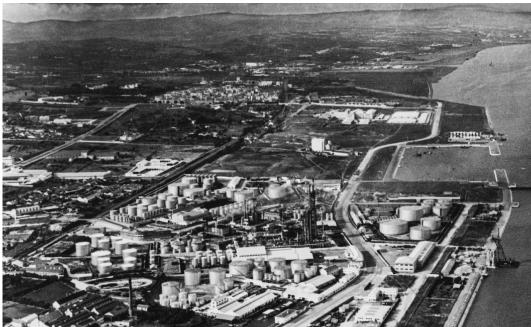
Vista aérea da zona ribeirinha oriental (meados do século XX)

A zona ribeirinha oriental de Lisboa sofre uma profunda transformação nos anos 40 do século XX, com o aumento de terraplenos e a criação de indústria pesada, como a fábrica de Gás da Matinha, a Refinaria da Sacor (em Cabo Ruivo) e posteriormente com a introdução do Matadouro Municipal, das instalações militares junto a Moscavide, e na zona mais a norte junto à foz do Trancão, a instalação da ETAR e do Aterro sanitário de Beirolos.