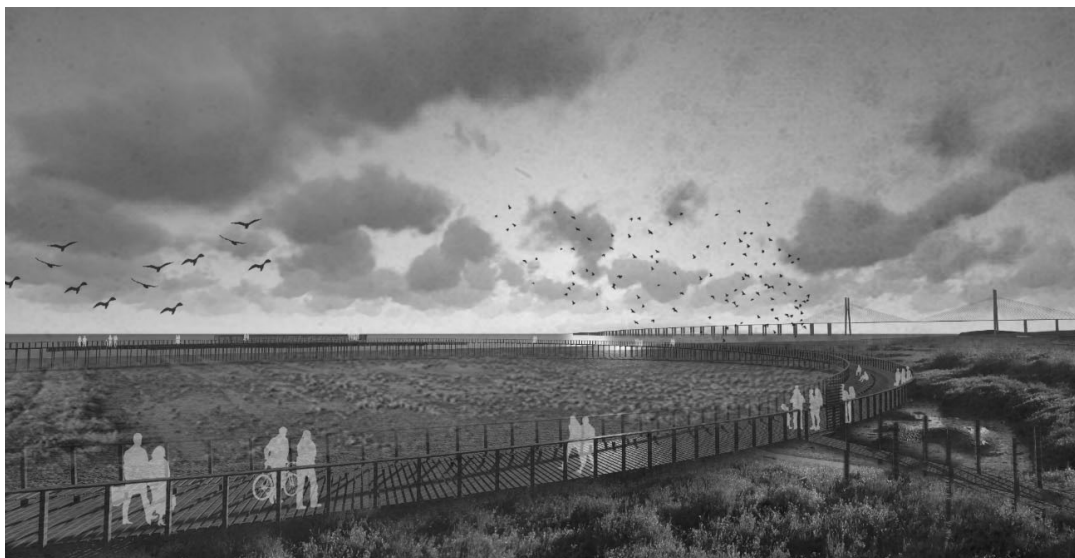
Fig.2 Ilustração da futura Frente Ribeirinha de Loures

Paralelamente surge a escolha da Cidade de Lisboa enquanto cidade anfitriã das próximas Jornadas Mundiais da Juventude 2022, evento no âmbito do qual se identifica a área do Aterro Sanitário de Beirolas como o local ideal para acolher os cerca de um milhão de peregrinos esperados.