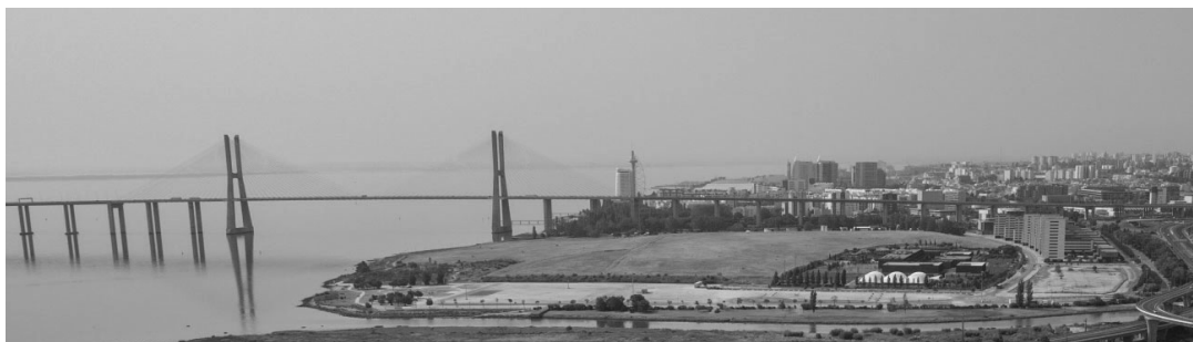
Aterro Sanitário de Beirolos . 2018 (selado)