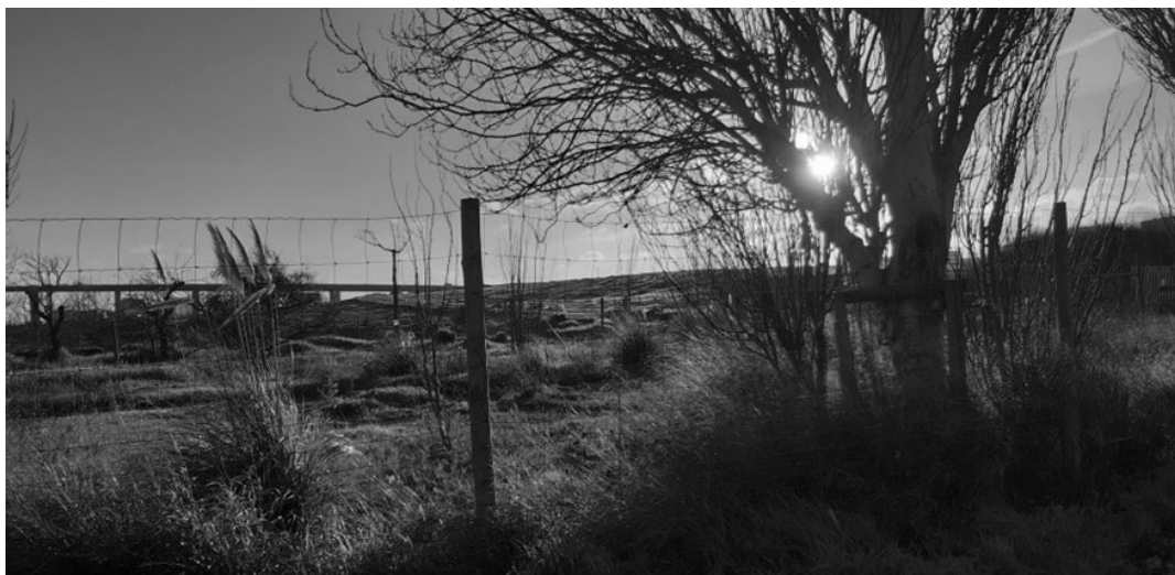
Vista para o aterro sanitário da área norte do concelho.

Dessa forma, esta área do Parque, prevista no Plano da Expo'98 e que foi objeto do Plano de Pormenor 6, foi deixada para concretização mais tardia, após a exposição, quando as circunstâncias o permitissem.