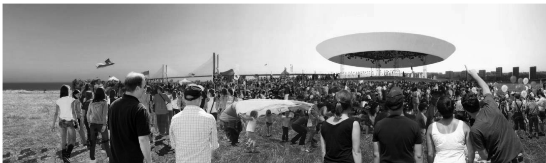
Fig.3 Ilustração das Jornadas Mundiais da Juventude na Área de Intervenção

Paralelamente surge a escolha da Cidade de Lisboa enquanto cidade anfitriã das próximas Jornadas Mundiais da Juventude 2022, evento no âmbito do qual se identifica a área do Aterro Sanitário de Beirolas como o local ideal para acolher os cerca de um milhão de peregrinos esperados.