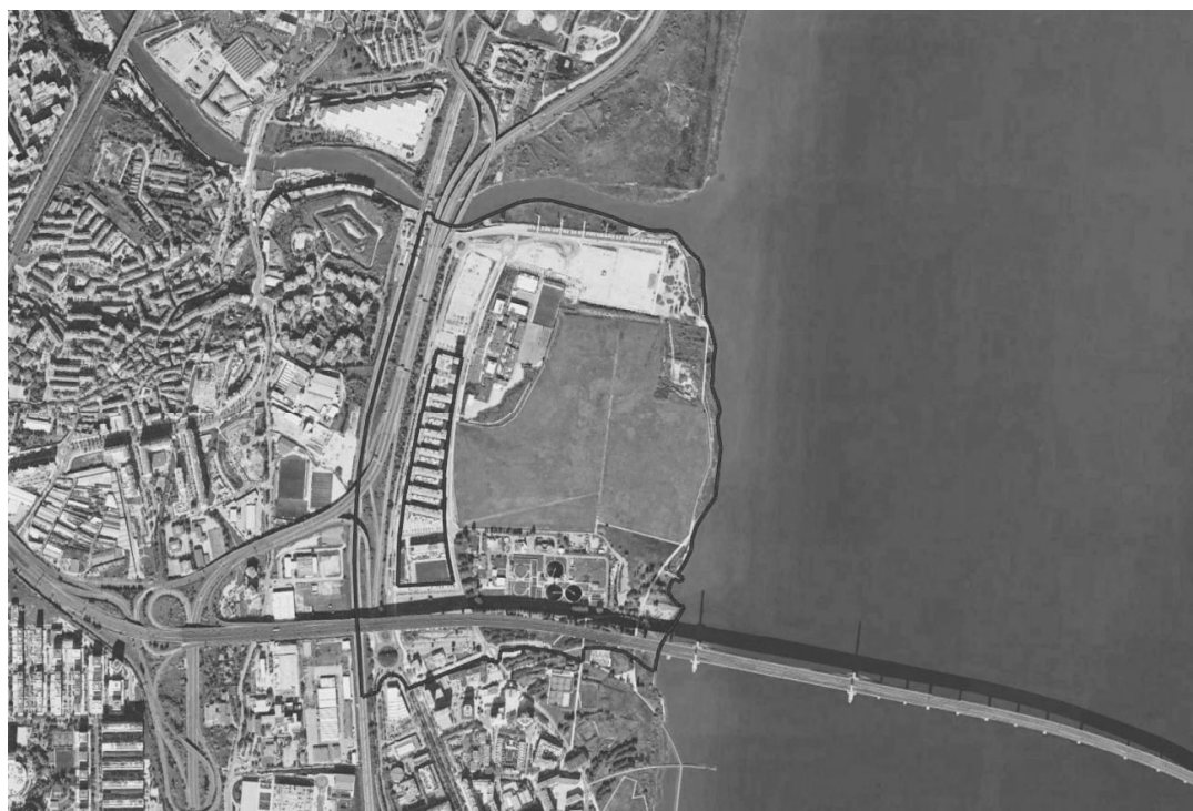
Fig.1. Limite da área de Intervenção da ARU sobre Ortofotomapa.

Totalizando cerca de 92 ha, a área delimitada abrange grande parte dos terrenos do PP6, e uma pequena área do PP5, delimitados pela Rua Príncipe do Mónaco e Ponte Vasco da Gama a Sul, o Rio Tejo a Este, o Rio Trancão a Norte e o Linha do Norte a Oeste.