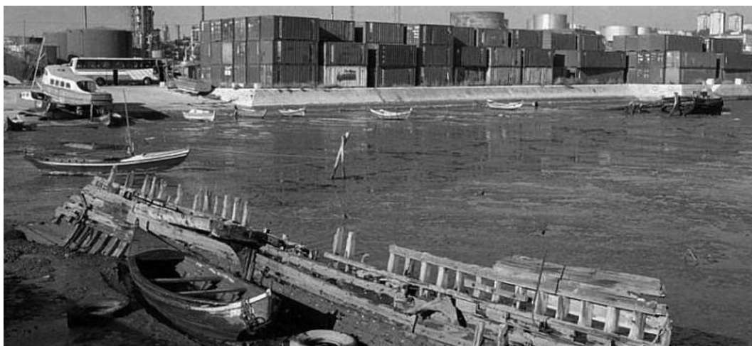
Doca dos Olivais nos anos 80 do século XX

No final dos anos 80 do século XX, tratava-se de uma zona altamente contaminada, em processo de desativação de funções industriais, com uma atividade logística desordenada em torno da Doca dos Olivais.