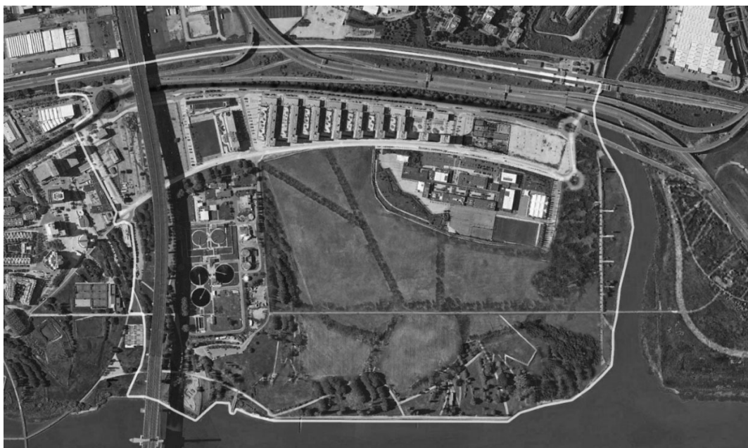
— Eixo TCSP — Eixo Ciclável

Considerando a especificidade das grandes intervenções a efetuar, da condição de fronteira intermunicipal e da existência, na área de intervenção, de grandes infraestruturas de âmbito regional e nacional, todo o processo subsequente procurará acomodar todos os contributos das entidades com responsabilidade e interesse na área de intervenção.