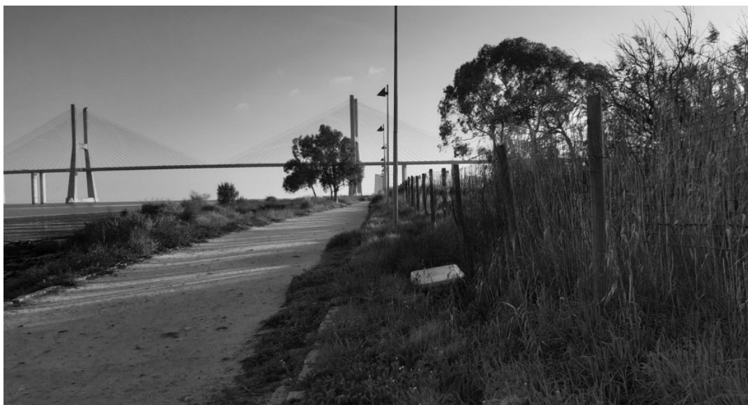
Percurso junto ao rio da área de intervenção da ARU.