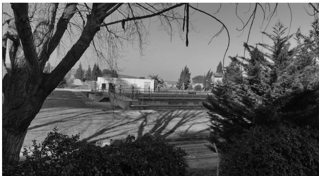
Início do “novo troço” do Percurso do Caminho do Parque que poderá ter continuidade com a ponte de atravessamento do Trancão.

Também o enquadramento paisagístico de toda a área, incluindo a que corresponde ao PP5 já edificada, fica prejudicado, não sendo valorizada a componente ribeirinha e natural que está incluída na REN ao longo das margens do Tejo e Trancão e que se inclui na estratégia do Plano Geral de Intervenções para a Frente Ribeirinha de Lisboa na perspectiva de melhorar a qualidade de vida dos utilizadores nas vertentes sociocultural, urbanística, ambiental e da comunidade .