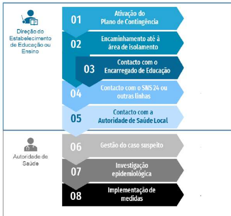
• Figura 1. Fluxograma de atuação perante um caso possível ou provável de COVID-19 em contexto escolar