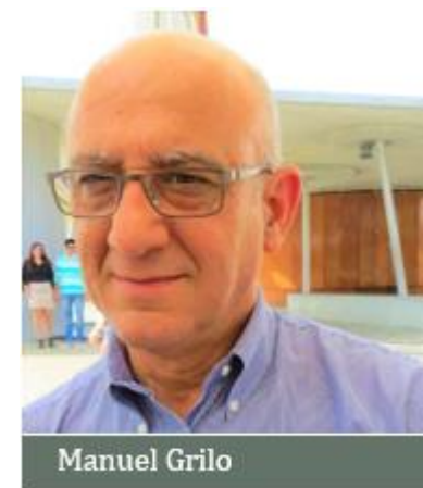
Vereador do Pelouro da Educação